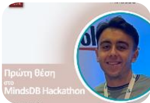
1 η θέση στο MindsDB Hackathon