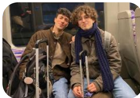
Συμμετοχή στο Πρόγραμμα "AI for the Common Good co-created with Microsoft"