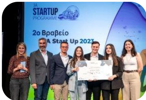
Cup n Track, 2 η θέση στον Πανελλήνιο Διαγωνισμό JA Start Up