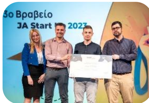
ContainerSense, 3 η θέση στον Πανελλήνιο Διαγωνισμό JA Start Up