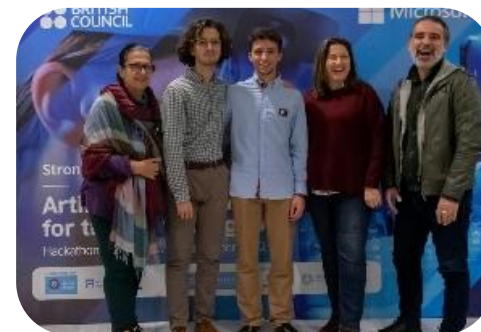
Διακρίσεις στο AI Hackathon "Stronger Together | Artificial Intelligence for the Common Good"