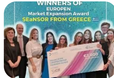
SEaNSOR, Πανερωπαϊκό Online Award "Market Expansion Award by EuroPen"