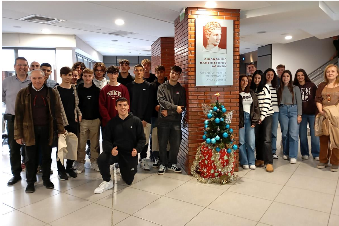
10/12/2024: Αναμνηστική φωτογραφία του 65 ου ΓΕΛ ΑΘΗΝΩΝ