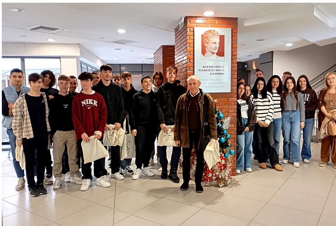
10/12/2024: Αναμνηστική φωτογραφία του 65 ου ΓΕΛ ΑΘΗΝΩΝ