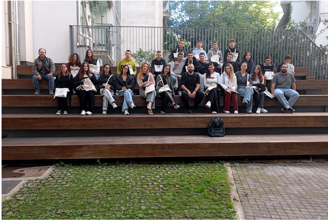
24/10/2024: Αναμνηστική Φωτογραφία του ΓΕΛ Κερατέας