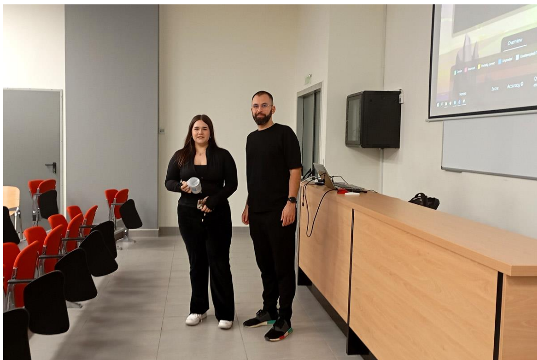
24/10/2024: Μαθήτρια που έχει κερδίσει στο παιχνίδι-διαγωνισμό, κατά την διάρκεια της εκπαιδευτικής επίσκεψης του σχολείου