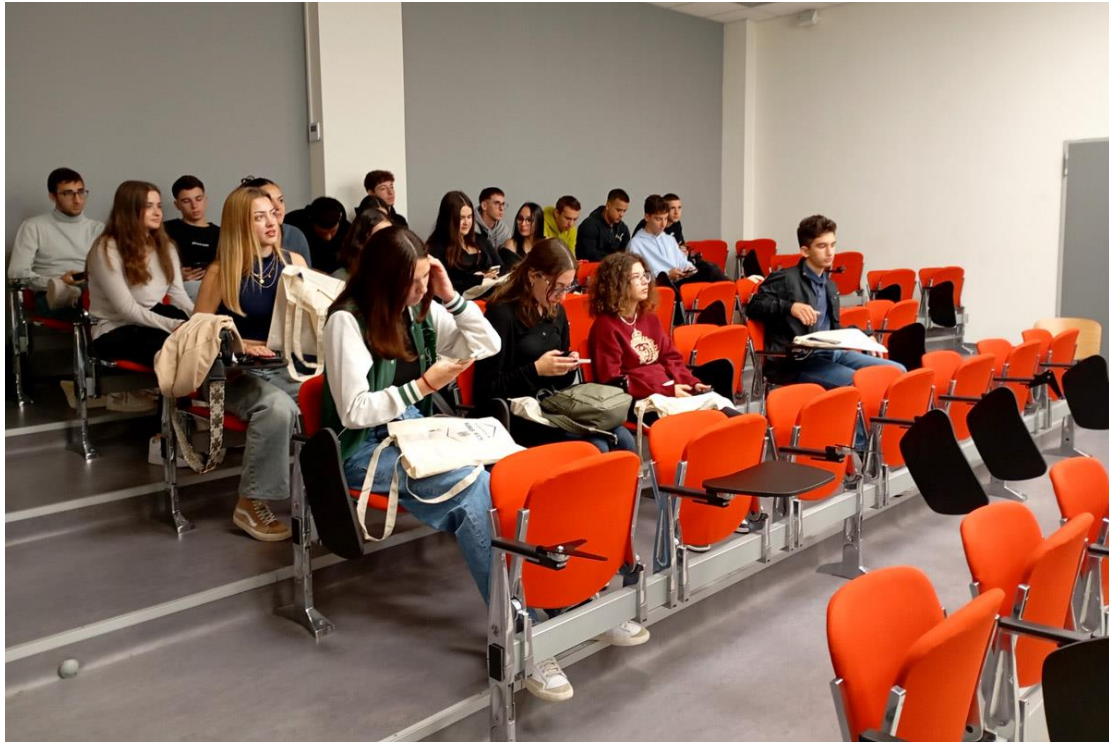
24/10/2024: Εκπαιδευτική Επίσκεψη του ΓΕΛ ΚΕΡΑΤΕΑΣ